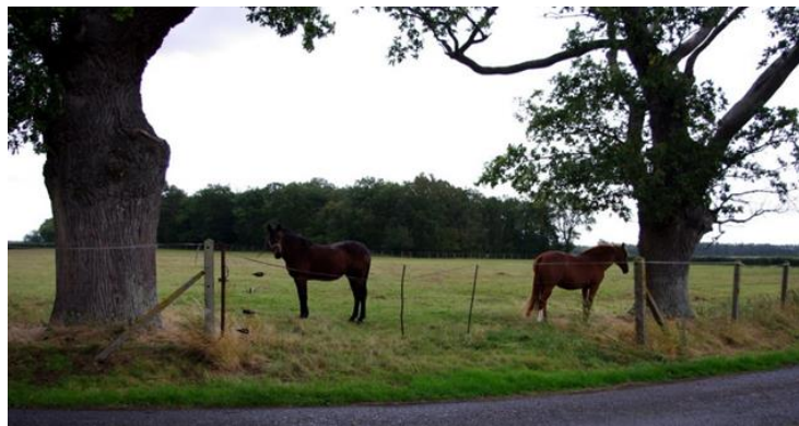
Photo 2 : Le paysage à proximité de la parcelle : un élément d'explication fort des observations

A dire d'experts, il semble que le paysage joue un rôle essentiel et primordial dans l'explication de cette résilience. Dès lors que le paysage présente une certaine diversité, avec notamment des bois ou des zones enherbées, l'expérimentation a pu montrer la présence d'espèces rares : Carabus monilis , Carabus auronitens ... Le paysage joue donc un rôle essentiel en tant que ressource de biodiversité. Mais pour que cette biodiversité ait une dimension fonctionnelle avec une certaine efficacité, il faut que les pratiques ne soient pas trop chargées en produits phytosanitaires et que le travail de sol soit modéré. Sur le plan technique, les systèmes en agriculture intégrée répondent bien à ces exigences, de fait, on a pu y observer des espèces rares à valeur patrimoniale et doublées d'une efficacité technique permettant l'absence de recours aux molluscicides.