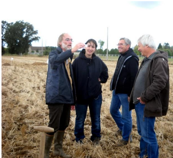
Photo 1 : des échanges à la recherche d'explications des observations

Pour expliquer ce résultat de l'année 3, plusieurs hypothèses ont été avancées, notamment grâce à la collaboration de Jean-Luc Roger. La variabilité entre les deux années peut s'expliquer par : des conditions climatiques qui diffèrent (car ce résultat s'observe sur l'ensemble des parcelles du réseau), une pratique culturale très perturbatrice du milieu (le labour qui fait suite à trois années de non travail de sol, mais avec des prélèvements réguliers lors des récoltes de fourrage). Seules survivent les espèces supportant ces perturbations. On retrouve également des espèces qui a priori viennent coloniser ce milieu rajeuni. A cela, il faut ajouter les variabilités annuelles d'émergence des carabes qui sont également liées aux conditions climatiques (l'année 2 a été caractérisée par un printemps pluvieux et frais, qui explique la plus faible proportion de Pterotichus melanarius par rapport à Poecilus cupreus qui émerge plus tôt que Pterostichus melanarius qui arrive un peu plus tard et surtout lorsque les conditions climatiques sont plus chaudes).