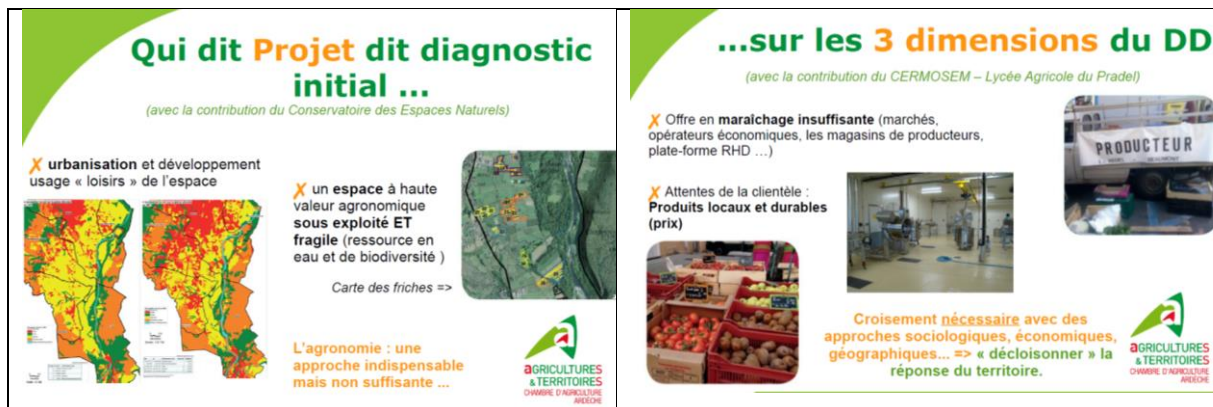
Figure 1 : Le diagnostic pour la préfiguration du PAT de l'Ardèche méridionale

Pour passer du diagnostic au projet de PAT, il est important de s'interroger sur le territoire pertinent du projet. Car qui dit projet alimentaire territorial dit politique alimentaire, ce qui suppose une gouvernance qui délibère et qui agit. Et là surgissent des difficultés d'organisation administrative, le zonage des potentialités agricoles ne correspondant pas au zonage de la gouvernance politique (communes, communautés de communes, PNR...). Le défi est alors de relier les deux types de territoires : le territoire administratif et le territoire du PAT. Dans le cas du PAT de l'Ardèche méridionale, le choix de partir du bassin de vie, qui était logique, se trouve ainsi confronté au fait qu'il croise trop de territoires administratifs et de projets, ce qui pose une véritable difficulté pour avancer. Et cela peut entraîner des frustrations pour les acteurs du PAT, en particulier les conseillers de la chambre d'agriculture qui aimeraient pouvoir créer les interactions entre territoires pour coordonner une offre de production en adéquation avec les besoins de la population.