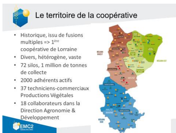
Figure 2 : Principales caractéristiques de la coopérative EMC2

Située dans l'Est de la France, sous un climat semi-continentale, la coopérative EMC2 est issue, comme beaucoup d'autres en France, de fusions successives, et elle est aujourd'hui la plus grosse coopérative de Lorraine (voir figure 2).