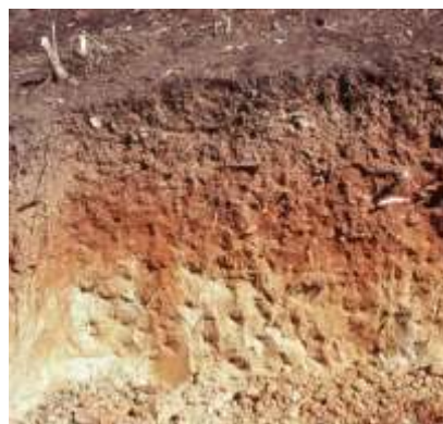
Photo Profil sol brun lessivé