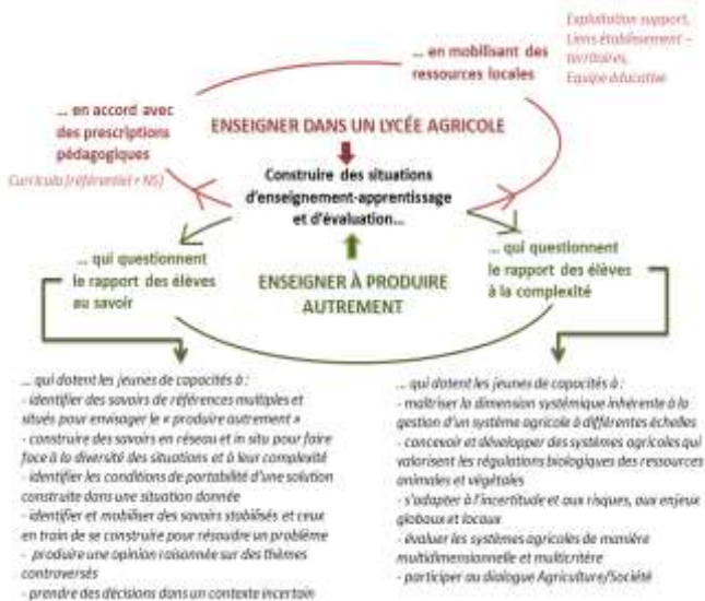
Fig 1. : Cadre de représentation des apprentissages visés dans les situations d'enseignement-apprentissage en lycée agricole pour enseigner à produire autrement

Fig.1: Conceptual framework of learning at stake in secondary agricultural schools to teach alternative ways of farming