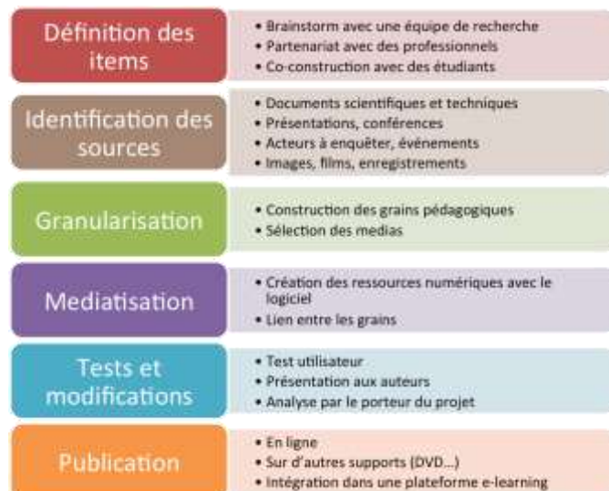
Figure 3 : Etapes de construction d'une ressource pédagogique numérique

vue sur ce qui est le plus efficace au niveau pédagogique et de leurs connaissances sur l'usage des ressources numériques. Il a fallu pour cela mettre en place un dispositif et une démarche de conception associant ces différents auteurs et la cellule TICE, sous la responsabilité d'un enseignant-chercheur. Ce dispositif doit permettre d'articuler les différentes étapes de construction (Figure 3) et les compétences requises et de maîtriser le temps nécessaire à la construction des ressources, notamment pour les auteurs.