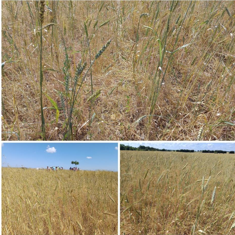
Parcelle 1 (sur les \frac{3}{4} de la parcelle)

Les blés de cette parcelle, (semé à la même date que le précédent et avec le même mélange variétal) sont mieux installés, plus denses, plus homogènes. Les plantes spontanées sont plus maîtrisées (mise à part le rumex qui revient souvent).