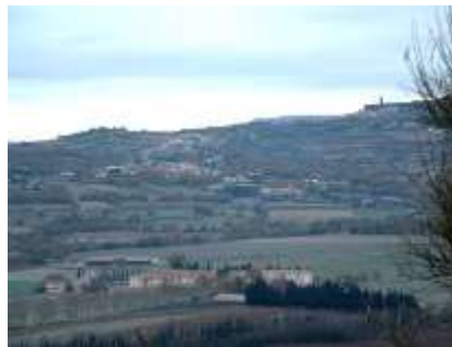
Le territoire dominé par le plateau du Coiron