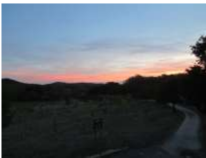
Le Verger conservatoire Sous la lumière de fin de journée