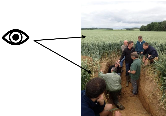
Figure 3 : double lecture de la coupe de sol réalisée grâce à la fosse creusée dans la parcelle d'un agriculteur Aciste du groupe ABC

Lors d'une première phase de travail, l'ABC fut appréhendée comme une addition de deux sous-groupes (AB/AC = ABC). D'une part les cultivateurs bio ambitionnaient de diminuer leur travail du sol et d'autre part, les cultivateurs en conservation des sols visaient à réduire l'usage des pesticides avec le soutien des deux ingénieurs et leurs équipes. L'ABC se réalisait donc, selon les objectifs alors fixés, dans la combinaison des forces et faiblesses des uns et des autres, dans l'apprentissage mutuel des pratiques des uns pour accompagner les changements des autres. C'était sans tenir compte des conflits identitaires et l'appréhension située du sol qui éclata au grand jour lors d'un tour de plaine.